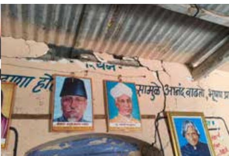
१९६३ ची इमारत; जीवघेणी परिस्थिती- शाळेची इमारत १९६३ साली विटा आणि चुन्यापासून बांधलेली असून सध्या

ती अत्यंत धोकादायक अवस्थेत आहे. भितींना मोठे तडे गेले आहेत, पत्रे गंजून गळती होत आहे, तसेच सिमेंटचे खपले कोसळत आहेत. अनेकदा वर्गात साप व विंचू आढळल्याच्या घटनाही घडल्या आहेत. नेम नसल्याने विद्यार्थ्यांना झाडाखाली बसवून शिक्षण द्यावे लागत आहे. वारंवार वरिष्ठ कार्यालयाकडे पाठपुरावा करूनही दखल घेतली जात नाही, अशी खंत