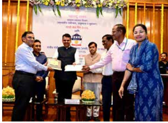
करत, प्रत्येक विभागाने स्वतः कडे एक स्वतंत्र स्टार्टअप म्हणून