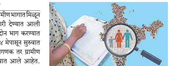
आहे. यासाठी तहसील कार्यालय, नगरपरिषदमधील अधिकारी आणि प्रमुख कर्मचाऱ्यांना देखील प्रशिक्षण देण्यात आले आहे. अंतर्गत प्रत्येक कुटुंबाची सविस्तर नोंद केली जाणार आहे. ग्रामपातळीवर शहरात प्रत्यक्ष कुटुंब सर्वेक्षण करणाऱ्या प्रशिक्षणार्थींना स्वतंत्र मानधन व भताही देण्यात येणार आहे.

बीड । प्रतिनिधी जनगणना प्रक्रियेसाठी शहर व ग्रामीण भागात मिळून एकूण २२१ कर्मचाऱ्यांवर जबाबदारी देण्यात आली असून, या कामासाठी तालुक्याचे दोन भाग करण्यात आले आहेत. प्रत्येक जनगणनेस १४ मेपासून सुरुवात होणार आहे. धारूर शहरात २६ प्रगणक तर ग्रामीण भागात १७५ प्रगणक नियुक्त करण्यात आले आहेत. संपूर्ण प्रक्रियेवर देखरेख ठेवण्यासाठी १७ सुपरवायझर, ३ मास्टर ट्रेनर यांची नियुक्ती करण्यात आली आहे. जनगणना प्रक्रिया ऑनलाईन पद्धतीने होणार असून, प्रत्येक कुटुंबाकडून ३१ प्रश्नांच्या आधारे माहिती संकलित करण्यात येणार आहे. गुरूवार, २३ एप्रिल रोजी कर्मचाऱ्यांचे प्रशिक्षण आयोजित करण्यात आले असून, प्रत्यक्ष जनगणना कामास १४ मेपासून सुरुवात होणार