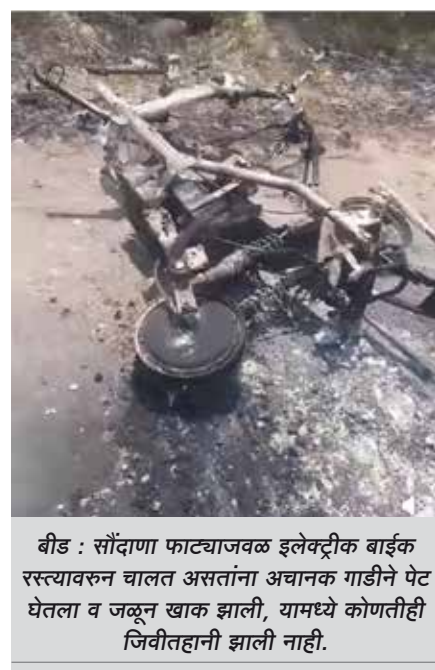
बीड : सांदाणा फाट्याजवळ इलेक्ट्रीक बाईक रस्त्यावरून घालत असतांना अचानक गाडीने पेट घेतला व जळून खाक झाली, यामध्ये कोणतीही जिवीतहानी झाली नाही.