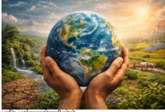
आणि अर्थव्यवस्थेवरही होते .

मानवाच्या सभ्यतेचा इतिहास पाहिला तर तो निसर्गाशी असलेल्या सुसंवादातूनच उभा राहिलेला दिसतो . पृथ्वीने माणसाला अन्न , पाणी , हवा , ऊर्जा आणि जीवनासाठी आवश्यक असलेली प्रत्येक गोष्ट दिली . या निसर्गाशी असलेल्या सुसंवादातूनच माणूस जगला , वाढला आणि प्रगत झाला . परंतु आधुनिक काळात विकासाच्या नावाखाली माणसाने निसर्गाशी असलेले हे नाते बदलले . उपयोग आणि उपभोग यामधील सीमारेषा पुसट झाली आणि त्याचा परिणाम म्हणून आज पृथ्वीवर अनेक संकटे उभी टाकली आहेत . पृथ्वी दिन हा त्या बदलत्या वास्तवाची जाणीव करून देणारा आणि माणसाला आत्मपरीक्षासाठी भाग पाडणारा दिवस आहे .