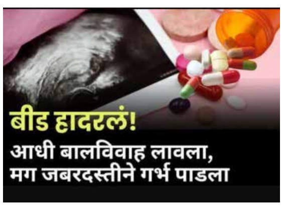
अनुसूचित जमातीच्या अवघ्या १६ वर्षे ३ महिने वय असलेल्या मुलीचा वर्षभरापूर्वी बेकायदेशीरपणे बालविवाह लावून देण्यात आला होता. मुलगी अल्पवयीन आहे हे माहीत असतानाही समाजातील

बीड । प्रतिनिधी बीड जिल्ह्यात प्रशासनाचे कायदे फक्त कागदावरच राहिले आहेत का? असा संतप्त सवाल आता विचारला जात आहे. जिल्ह्याच्या केज तालुक्यातून एक अत्यंत संतापजनक आणि सुन्न करणारी घटना समोर आली आहे. खेळण्या- बागडण्याच्या वयात एका १६ वर्षांच्या अल्पवयीन मुलीचा बळजबरीने बालविवाह लावून दिल्यानंतर, तिच्यावर झालेल्या अत्याचारातून ती गर्भवती राहिली आणि अखेर तिचा अवैध गर्भपात करण्यात आल्याचा धक्कादायक प्रकार उघडकीस आला आहे. मिळालेल्या माहितीनुसार, केज तालुक्यातील एका गावातील