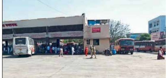
पार्किंगच्या ठिकाणी दराचा फलक असणे बंधनकारक आहे, पण येथे तो जाणीवपूर्वक लपवण्यात आला असून कोणतीही अधिकृत पावती न देता पैसे उकळले जात आहेत. बस स्थानक प्रशासन आणि पार्किंग कंत्राटदार यांच्यात असलेल्या अर्थपूर्ण संबंधांमुळेच

केंद्र? ही व्यथा केवळ एका प्रवाशाची नाही, तर जिल्ह्याचं मुख्य केंद्र असलेल्या बीड बस स्थानकात रोज येणाऱ्या हजारो नागरिकांची आहे. सध्या बीड बस स्थानकाचा कारभार रामभरोसे झाला असून, पार्किंगच्या नावाखाली प्रवाशांची उघडपणे लूट सुरू आहे. विशेष म्हणजे, या लुटीकडे प्रशासन का दुर्लक्ष करत आहे, असा सवाल आता विचारला जात आहे. नियमानुसार