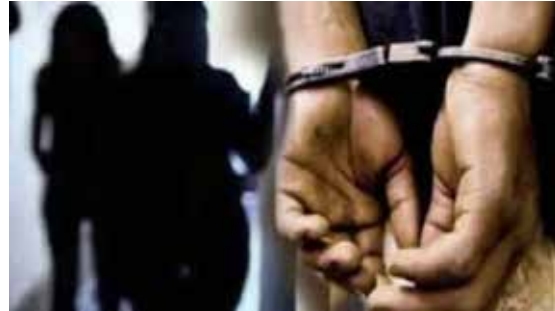
कारवाईमुळे पुन्हा एकदा सिद्ध झाली की बीड जिल्ह्यात लाच मागण्याच्या

बीड । प्रतिनिधी जिल्ह्यात लाचखोरीचे प्रकार दिवसेंदिवस वाढत असल्याचे पुन्हा एकदा स्पष्ट झाले आहे. विशेष म्हणजे, गेवराई तालुक्यात ग्रामसेवकाला लाच घेताना रंगेहात पकडल्याची घटना ताजी असतानाच अवघ्या २४ तासांत आष्टी येथे महिला सहाय्यक अभियंता एसीबीच्या जाळ्यात अडकल्याने जिल्ह्यात एकच खळबळ उडाली आहे. या