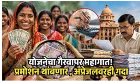
योजनेचा गैरवापर महागात! प्रमोशन थांबणार, अप्रेजलवरही गदा

धक्कादायक बाब म्हणजे, या योजनेचा गैरफायदा घेणाऱ्यांमध्ये मोठ्या संख्येने सरकारी कर्मचारी आणि पुरुष आहेत. जे पात्रतेच्या निकषानुसार स्पष्टपणे अपात्र होते.