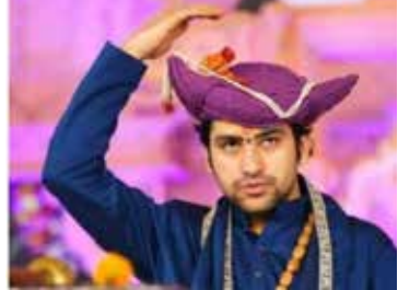
अकलेचे तारे तोडले. छत्रपती शिवराय लढून थकले. अखेर त्यांनी समर्थ रामदास यांना राजपाट सांभाळण्याची विनंती केली, असे

नागपूर । प्रतिनिधी छत्रपती शिवरायांच्या हिंदवी राज्याच्या स्थापनाकडे पाहून आम्ही हिंदू राष्ट्राचे स्वप्न बघत आहोत. छत्रपती शिवरायांचा अर्चमान तर सोडा, त्यांच्याविषयी आम्ही स्वप्नातही वाईट ऐकू शकत नाही किंवा पाहू शकत नाही. माझ्या विधानाला वेगळ्या पद्धतीने दाखवले गेले, मला खूप वाईट वाटते आहे. ज्यांना माझ्या विधानाने वाईट वाटले असेल त्यांची मी माफी मागतो, दिलगिरी व्यक्त करतो, असे बागेश्वर बाबांनी म्हटले. नागपूरमध्ये एका आयोजित कार्यक्रमात धीरेंद्र शास्त्री यांनी छत्रपती शिवरायांबद्दल