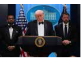
ट्रिट करत भारताची भूमिका स्पष्ट केली असून ट्रम्प यांच्या सुरक्षेबद्दल समाधान व्यक्त केले आहे. पंतप्रधान मोदींची प्रतिक्रिया या घटनेवर >>> उर्वरित पान २ वर

वृत्तसंस्था वाशिंग्टन - अमेरिकेचे राष्ट्राध्यक्ष डॉनाल्ड ट्रम्प उपस्थित असलेल्या वाशिंग्टनमधील हिल्टन हॉटेलमधील एका कार्यक्रमात शनिवारी रात्री गोळीबाराची धक्कादायक घटना घडली. 'व्हाईट हाऊस कॉन्सर्न्स-डेंट्स डिनर' सुरू असताना मोठे आवाज ऐकू आले, ज्यामुळे एकच खळबळ उडाली. या घटनेनंतर पंतप्रधान नरेंद्र मोदी यांनी