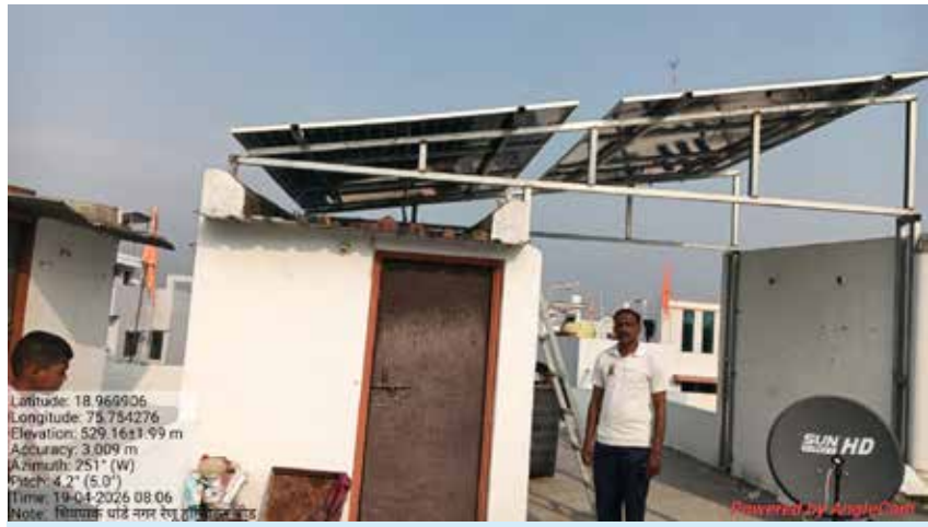
वीड: सूर्य घर मोफत वीज अशी सरकारची योजना सुरू आहे आणि या योजनेपासून बऱ्याच लोकांनी आपल्या घरावरील सोलर बसवले आहेत व वीजबिलापासून सुटकारा मिळेल पण सध्या सरकारने या सोलर वरील टॅक्स लावण्याचा विचार केला आहे आणि तो लवकर अमलात येईल पण हे कितपत योग्य आहे या सोलर वीजनिर्मितीपासून बरेचसे फायदे होत आहेत तरी जनता वीज वापरपासून संदर्भात जागरूक होत आहे होणारे प्रदूषण पण या सरकारला फक्त कुठल्या ना कुठल्या माध्यमातून जनतेकडून टॅक्स वसूल करायचा आहे यामुळे ज्या लोकांनी सोलर बसवला आहे त्यांच्यामध्ये खूप मोठी निराशा व सरकार विषय नाराजी दिसून येत आहे सोलर ग्राहकांना टॅक्स लावणे हे चुकीचे धोरण आहे सर्वसामान्य लोकांनी बँकेचे लोन करून सोलर आपल्या घरावरील बसवले आहेत

इतर महाविद्यालयांमध्येही विद्यार्थ्यांकडून अतिरिक्त शुल्क आकारणी होत असल्यास त्याची शहानिशा करून अशा प्रकारांवर कठोर कारवाई करण्याचे निर्देश शही विभागीय सहसंचालक, उच्च शिक्षण यांना देण्यात आले आहेत. विद्यार्थ्यांच्या शैक्षणिक हिताचे संरक्षण आणि महाविद्यालयांमधील शुल्क निर्धारण प्रक्रियेत पारदर्शकता राखण्यासाठी शासन कटिबद्ध असल्याचेही उच्च व तंत्र शिक्षण मंत्री चंद्रकांतदादा पाटील यांनी सांगितले.