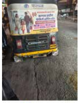
नसल्याचे चित्र दिसते. इंडिकेटरचा वापर करणे हा मूलभूत वाहतूक

शहरात तीन चाकी ऑटोचालकांकडून सुरू असलेली दादागिरी दिवसेंदिवस वाढताना दिसत आहे. वाहतूक नियमांचा सर्रास भंग होत असून विशेषतः इंडिकेटरचा वापर न करता वाहन चालवणे, अचानक वळणे घेणे आणि प्रवाशांच्या तसेच इतर वाहनचालकांच्या जीवाशी खेळ करणे, ही बाब चिंताजनक ठरत आहे. शहरातील मुख्य रस्त्यांवर ऑटोचालकांकडून कोणत्याही प्रकारची शिस्त पाळली जात