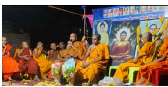
विचारांचे महत्त्व अधोरेखित केले. त्यांनी समता, बंधुता व शिक्षणाचा संदेश देत समाजाने या विचारांवर चालण्याचे आवाहन केले. लहान मुलांच्या भाषणांचा कार्यक्रम पार पडला. बालकांनी बुद्ध व आंबेडकरांच्या जीवनकार्यावर प्रभावी विचार मांडले. सायंकाळी