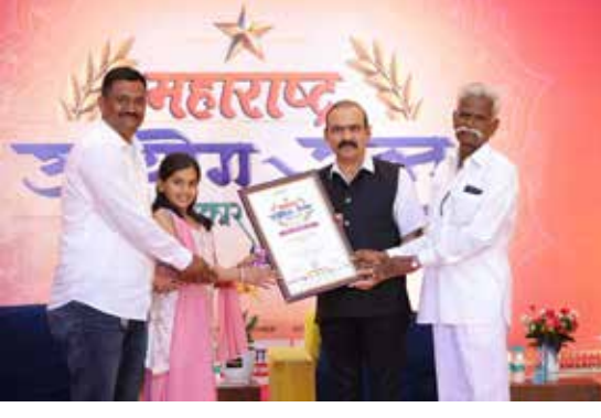
गौरव करण्यासाठी हा पुरस्कार उशीशरश.ळप या संस्थेकडून प्रत्येक वर्षी दिला जातो. मिराई नगरी सहकारी पतसंस्थेने ग्राहकाभिमुख सेवा, पारदर्शक व्यवहार आणि आर्थिक सबलीकरणच्या दृष्टीने केलेल्या

बीड । प्रतिनिधी मिराई नगरी सहकारी पतसंस्था मर्यादित, बीड यांना महाराष्ट्र उद्योगरत्न पुरस्कार २०२६ या प्रतिष्ठित पुरस्काराने सन्मानित करण्यात आले आहे. वित्तीय सेवा क्षेत्रात सहकार क्षेत्रातील उत्कृष्ट कामगिरीबद्दल हा पुरस्कार प्रदान करण्यात आला. हा पुरस्कार १ मे २०२६ रोजी नाशिक येथे पार पडलेल्या सोहळ्यात महाराष्ट्राचे सुप्रसिद्ध अभिनेते मा. श्री मकरंद अनासपुरे यांच्या हस्ते देण्यात आला. उद्योग व सहकार क्षेत्रात उल्लेखनीय कार्य करणाऱ्या संस्था व उद्योजकांचा